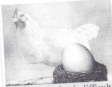
Every beginning is difficult